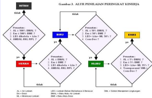
Gambar 3. ALUR PENILAIAN PERINGKAT KINERJA